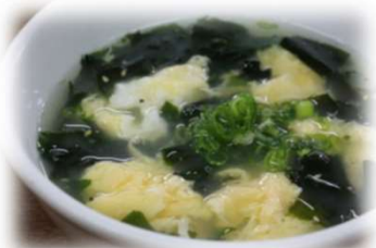
ワカメたまごスープ 430円 (税込473円)