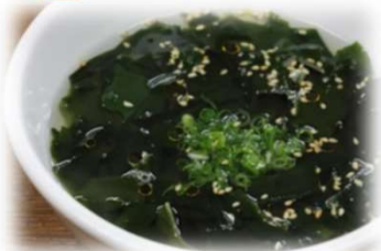
ワカメスープ 350円 (税込385円)