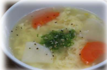
たまごスープ 360円 (税込396円)