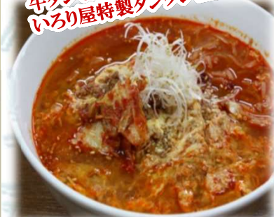
タンタン温麺 880円 (税込968円)