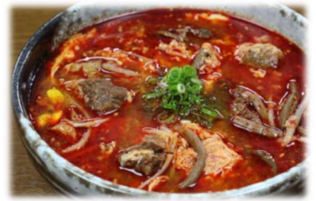
カルビクッパ 980円(税込1,078円)