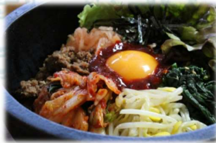
石焼ビビンバ 980円(税込1,078円)