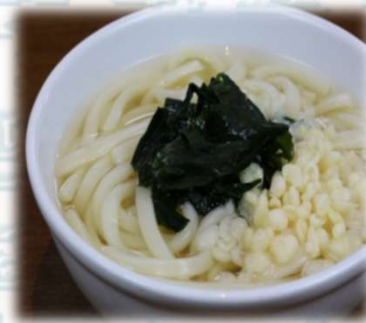
うどん 350円 (税込385円)