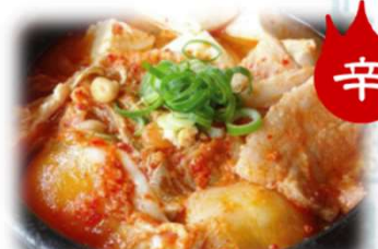
辛 豆腐チゲ 800円 (税込880円)