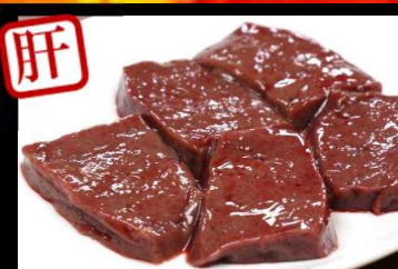
焼レバー650円(税込715円)