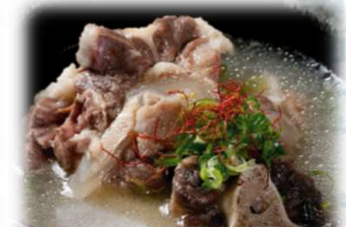
テールスープ 1,000円 (税込1,100円)