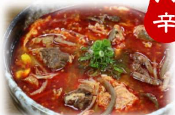
辛 カルビスープ 880円 (税込968円)